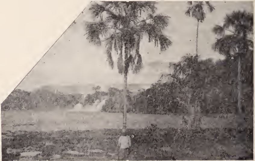
Cascadas, un remanso del río, selva y montaña, un conjunto armonioso de la Gran Sabana.